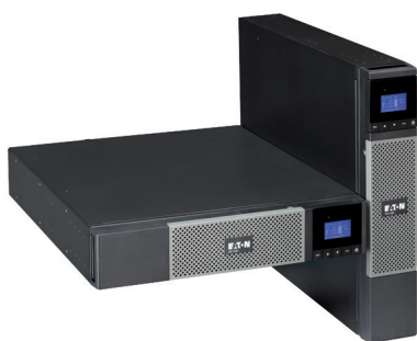
И для стоек и башенное

Непревзойденная эффективность, управляемость и возможности учета энергопотребления для IT-специалистов